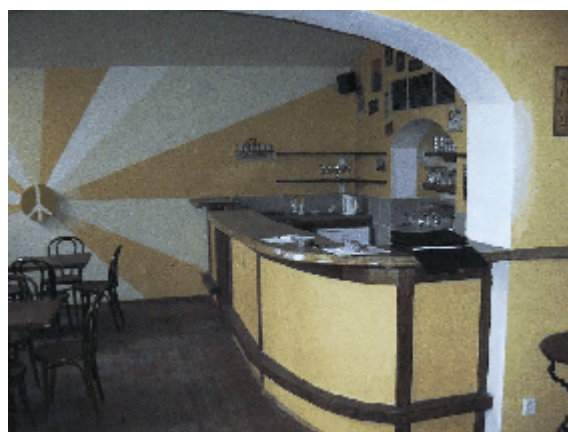
Interiér oceňovaného nebytového prostoru