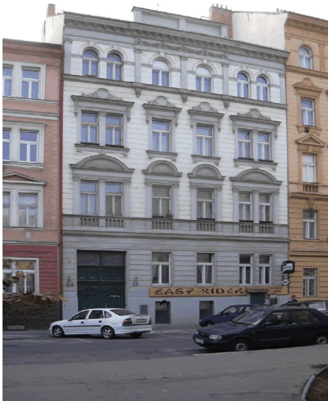
Budova č.p. 1112 v Bořivojově ulici na Žižkově.