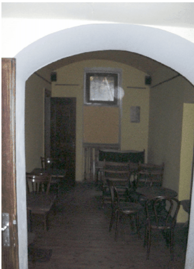
Interiér oceňovaného nebytového prostoru