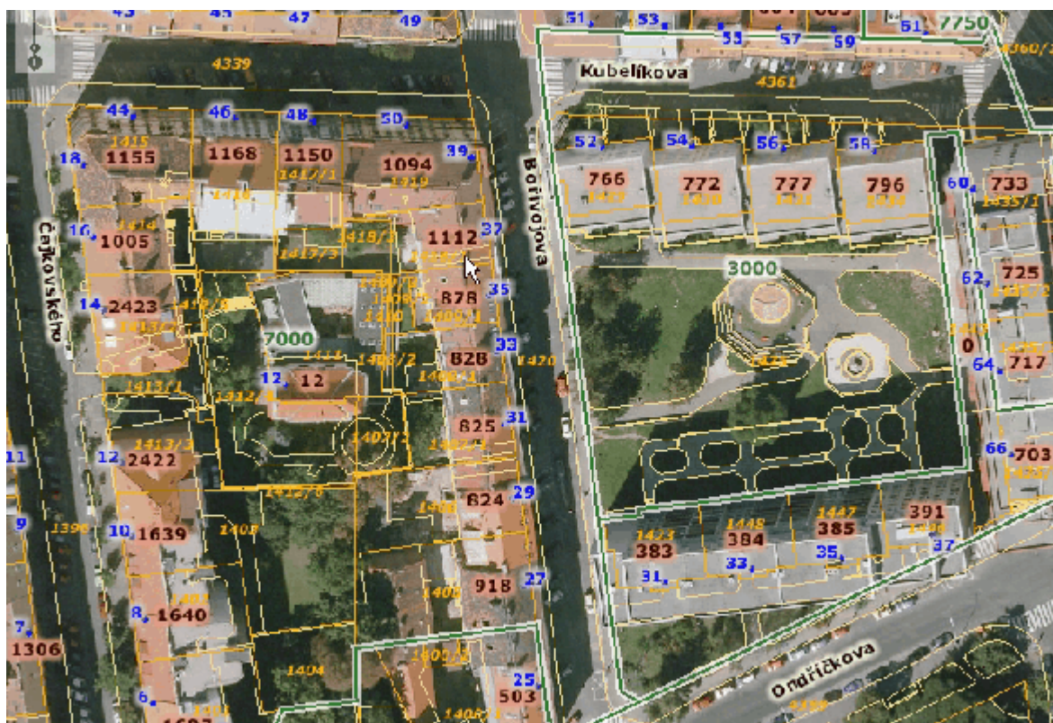
Letecký snímek s katastrální mapou, mapou čísel popisných a čísel orientačních HMP